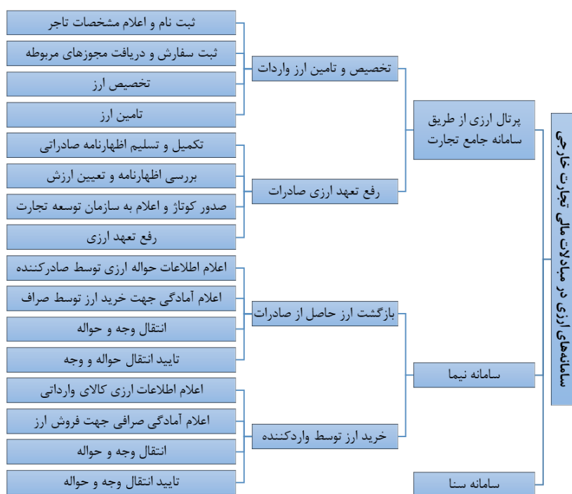
نمودار ب. سامانه‌های ارزی در مبادلات مالی تجارت بین‌الملل

با توجه به شرایط فعلی کشور، روش‌های حواله‌ای پیش‌پرداخت و حواله‌ای حساب باز بیش از سایر روش‌ها توسط تاجران ایرانی استفاده می‌شود. این حواله‌های ارزی عمدتاً به کمک شبکه صرافی در کشورهای مختلف و در برخی از موارد با استفاده از شبکه بانکی محدود، از طریق سامانه‌های ارزی مورد استفاده در مبادلات مالی تجارت خارجی مدیریت می‌شود.