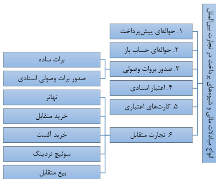
نمودار الف. انواع مبادلات مالی و شیوه‌های پرداخت در تجارت بین‌الملل

با توجه به شرایط فعلی کشور، روش‌های حواله‌ای پیش‌پرداخت و حواله‌ای حساب باز بیش از سایر روش‌ها توسط تاجران ایرانی استفاده می‌شود. این حواله‌های ارزی عمدتاً به کمک شبکه صرافی در کشورهای مختلف و در برخی از موارد با استفاده از شبکه بانکی محدود، از طریق سامانه‌های ارزی مورد استفاده در مبادلات مالی تجارت خارجی مدیریت می‌شود.