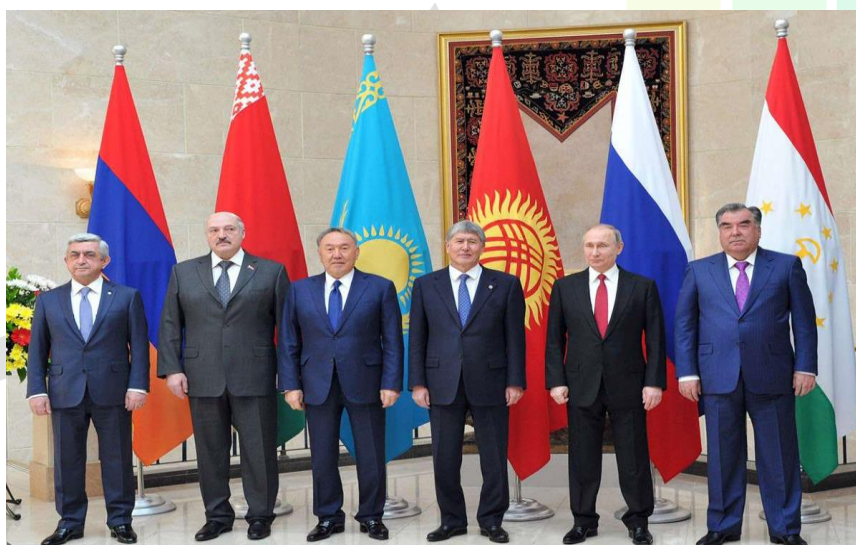
تصویر ۱. سران کشورهای عضو اتحادیه اقتصادی اوراسیا

اتحادیه از سه رکن «شورای عالی اقتصادی»، «شورای بین دولتی» و «کمیسیون اقتصادی» و یک نهاد قضایی تحت عنوان «دادگاه اتحادیه اقتصادی اوراسیا» تشکیل شده است. مهمترین رکن این اتحادیه شورای عالی اقتصادی است که سران کشورهای عضو اعضای آن را تشکیل می دهند. پس از آن شورای دولتی است که نخست وزیران کشورهای عضو اعضای آن هستند. رکن اجرایی این اتحادیه نیز کمیسیون اقتصادی است که از هر یک از پنج کشور اتحادیه دو نفر در آن عضو هستند؛ همچنین بیش از هزار کارشناس مرتبط با امور اقتصادی در این کمیسیون شاغل هستند. مقر این کمیسیون مسکو است و وظیفه آن نظارت بر امور گمرکی اتحادیه است.