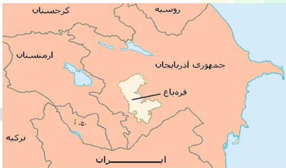
نقشه ۱. نقشه مرزی ایران و ارمنستان

این کشور پس از استقلال بحران های اقتصادی و سیاسی زیادی را به خود دیده است. شاید مهمترین بحران این کشور مسئله قره باغ باشد که اقتصاد این کشور را نیز بسیار تحت تاثیر قرار داده است. ارمنستان از سال ۱۹۹۱ بر سر تسلط بر منطقه قره باغ با آذربایجان اختلاف دارد و در دو مقطع که یکی از آن ها سال گذشته بود با آذربایجان وارد درگیری نظامی شد. به خاطر همین مسئله کشور ترکیه، همسایه غربی ارمنستان که از زمان عثمانی تا کنون با این کشور روابط خوبی نداشته است، در حمایت از آذربایجان مرزهای خود را به روی ارمنستان بست. از طرفی روابط این کشور با گرجستان، همسایه شمالی اش نیز به خاطر همین مسئله قره باغ همواره افت و خیزهای زیادی داشته است. بنابراین این کشور روابط خوبی با همسایگان شرقی، شمالی و غربی خود ندارد و همواره از جانب آن ها تحت فشار بوده است.