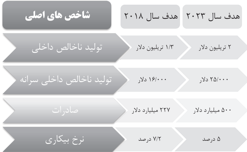
شکل ۲ - اهداف کمی برنامه‌های وزارت توسعه ترکیه

برنامه‌های میان مدت توسعه: برنامه‌های میان مدت ۱ وزارت توسعه ترکیه با هدف دستیابی به استراتژی‌های تعیین شده در سند توسعه است. این برنامه‌ها در واقع یک خطی مشی و نقشه راه برای هدایت سیاست‌های بخش عمومی و تخصیص منابع تعیین می‌کند.